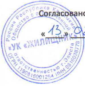
Схема разграничения балансовой принадлежности